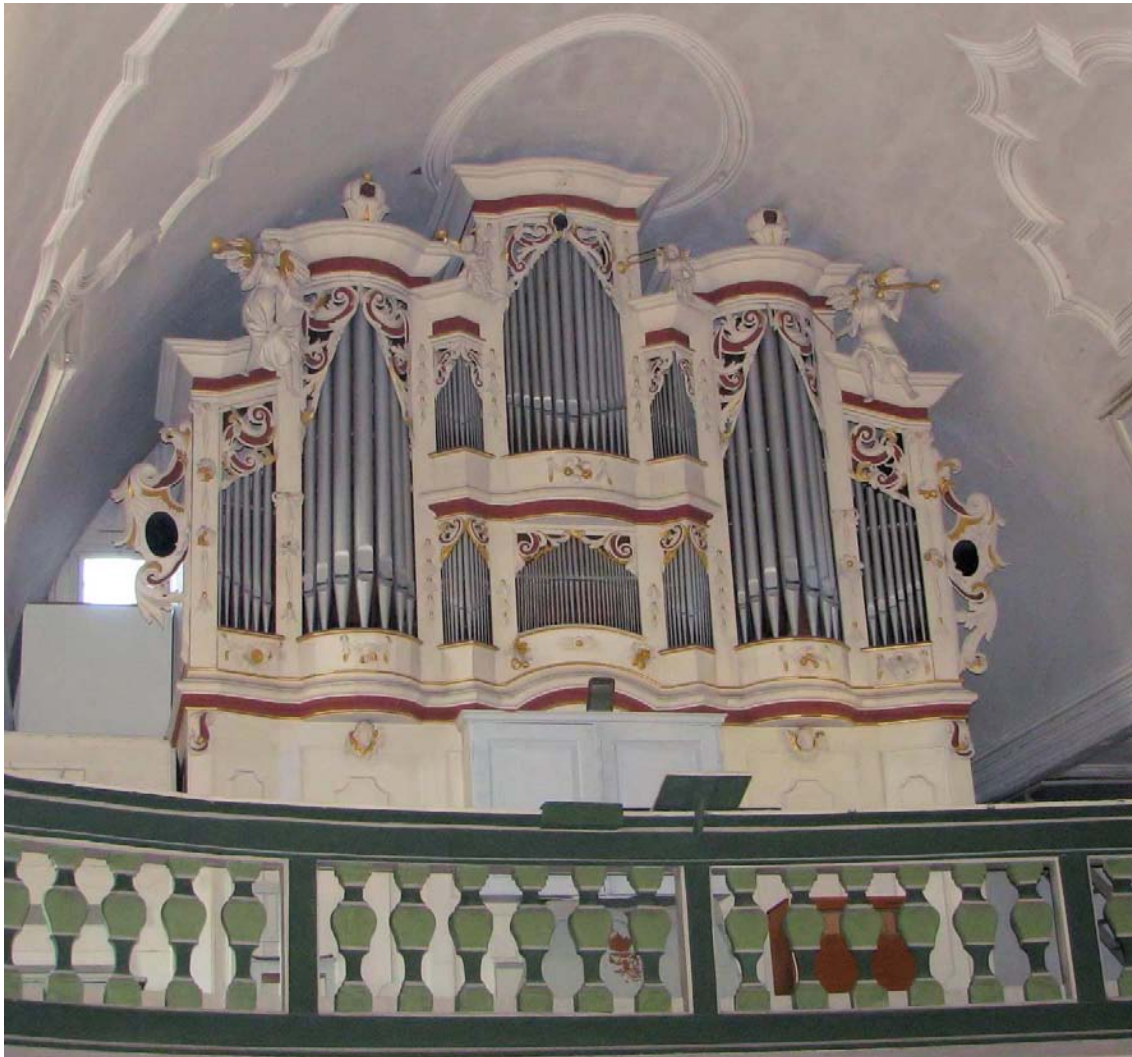
Abb. 14: Die Scherff-Orgel auf der Westempore

Der schöne Prospekt von Scherff ist im maßvollen Barock gehalten. Das Instrument ist aus dieser Zeit bis auf Umdisponierungen noch zu 80 % im Originalzustand erhalten und steht unter Denkmalschutz. Es ist ein Zeugnis hoher Handwerkskunst unserer Vorfahren, ein wertvolles Instrument aus der breitgefächerten Orgellandschaft Thüringens und wohl das älteste im Jenaer Raum.