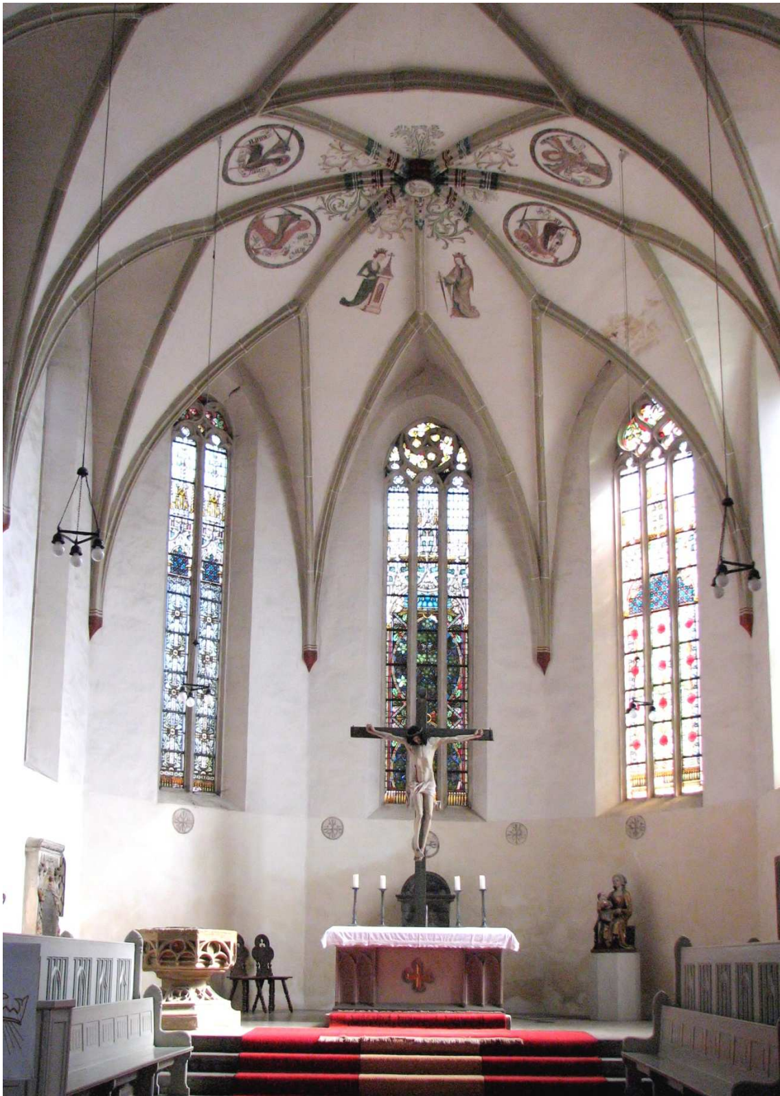
Abb. 9: Der Chorraum mit dem Altar

umgeben ist, einen zweiten, sorgfältig ausgehauenen und bemalten, in dessen Nähe wir keine figürlichen Darstellungen finden, und den dritten, wieder von Ranken und Figuren umgeben, in der Nähe des Triumphbogens.